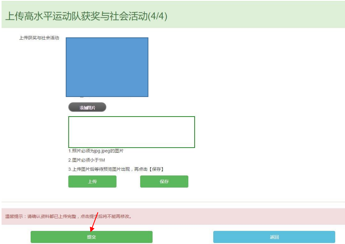
上传申请表及提交示例截图

七、在最新版本的申请表上按要求签字、盖章后，可扫描上传申请表（4 张表，包括报名信息、基本信息、成绩信息、获奖与社会活动），点击【添加图片】、【上传】、【保存】即可。上传完成后，点击【提交】。